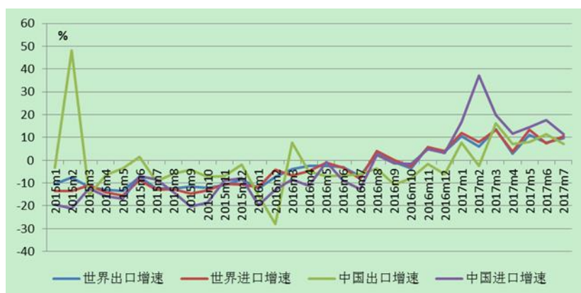
图 1 世界和中国外贸额月度同比增速

贸易增速的预测值从 2.4% 提升至 3.6%，预测区间在 3.2%-2.9%。这将超过以市场汇率计算的世界国内生产总值（GDP）增速。