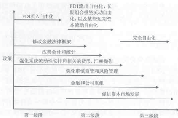
图3 资本自由流动的综合框架

国际货币基金组织强调,资本自由流动并不意味着不能采取资本流动管理措施,在某种环境下临时性引入资本流动管理措施与资本流动自由化的整体战略并不冲突。当一国面临资本大幅流入或流出危机时,实施资本流动管理措施是合意的,但是这种政策的实施应是有限的和临时性的。另外,如果自由化的步伐超出一国经济的承受能力,这时也可以实施资本流动管理措施,直到宏观经济、