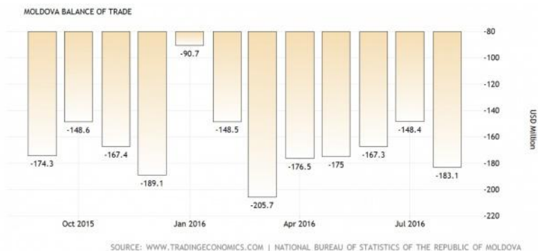
表 2 2015 年下半年以来摩尔多瓦贸易收支情况 单位：年度/百万美元

数据来源：Молдавия взяла обратный курс на Россию? http://ktovkurse.com/politika/moldaviya-vzyala-obratnyj-kurs-na-rossiyu . 31.10.2016,15:34.